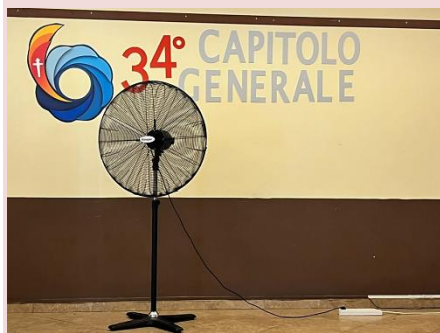
Aria (nuova?) in Capitolo